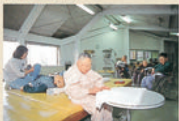
仲間と一緒に機能訓練