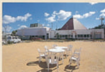
老人ケアセンター浅井

ゆとりをもった家庭的な環境で、介護、リ ハビリテーションを必要とするお年寄り (特に偏楽の方々)の皆さんを対象に、入所 サービスと在宅支援サービスを行っています。 入所サービスでは、医療・看護・介護 ・リハビリの提供を行っています。また在 宅支援サービスでは、デイ・ケア、ナイト ・ケア、ショートステイ(短期入所)により、 あたたかい老人ケア、家庭介護の支援をい たします。