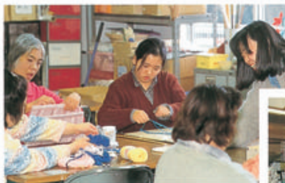
リハビリテーションでの活動