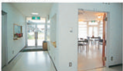
採光の大きな明るい室内

居室は1人部屋7室、2人部屋7室で構 成されています。日々の運営は施設長1 名、生活指導員3名が関わっていますが、 入寮者による積極的な話し合いでの自治 活動が中心です。