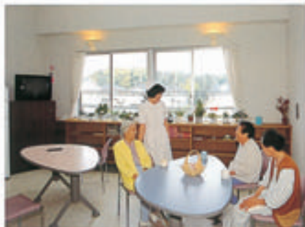
広く明るい共有スペース