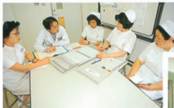
医師と看護婦による申し送り