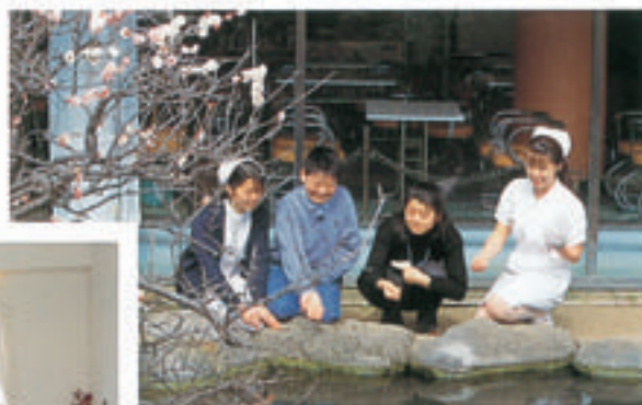
院内、梅林と池のほとり

これからもこの両方をもっと充実させようと、浅井病院ではみんなでお話し合っています。