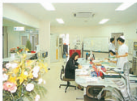
ナースステーションとPICU